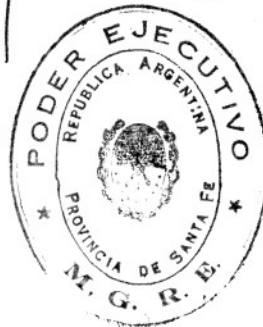
HERMES JUAN BINNER GOBERNADOR DE SANTA FE